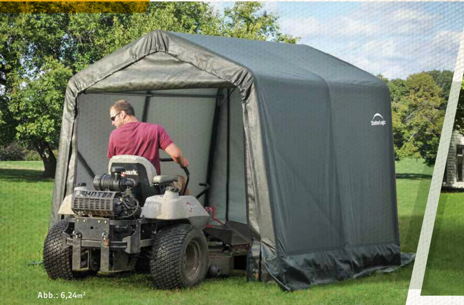
Abb.: 6,24m 2