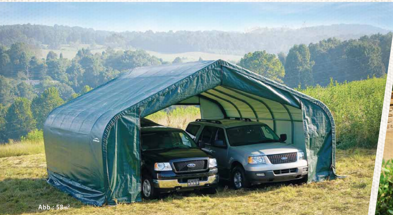
Abb.: 58m 2