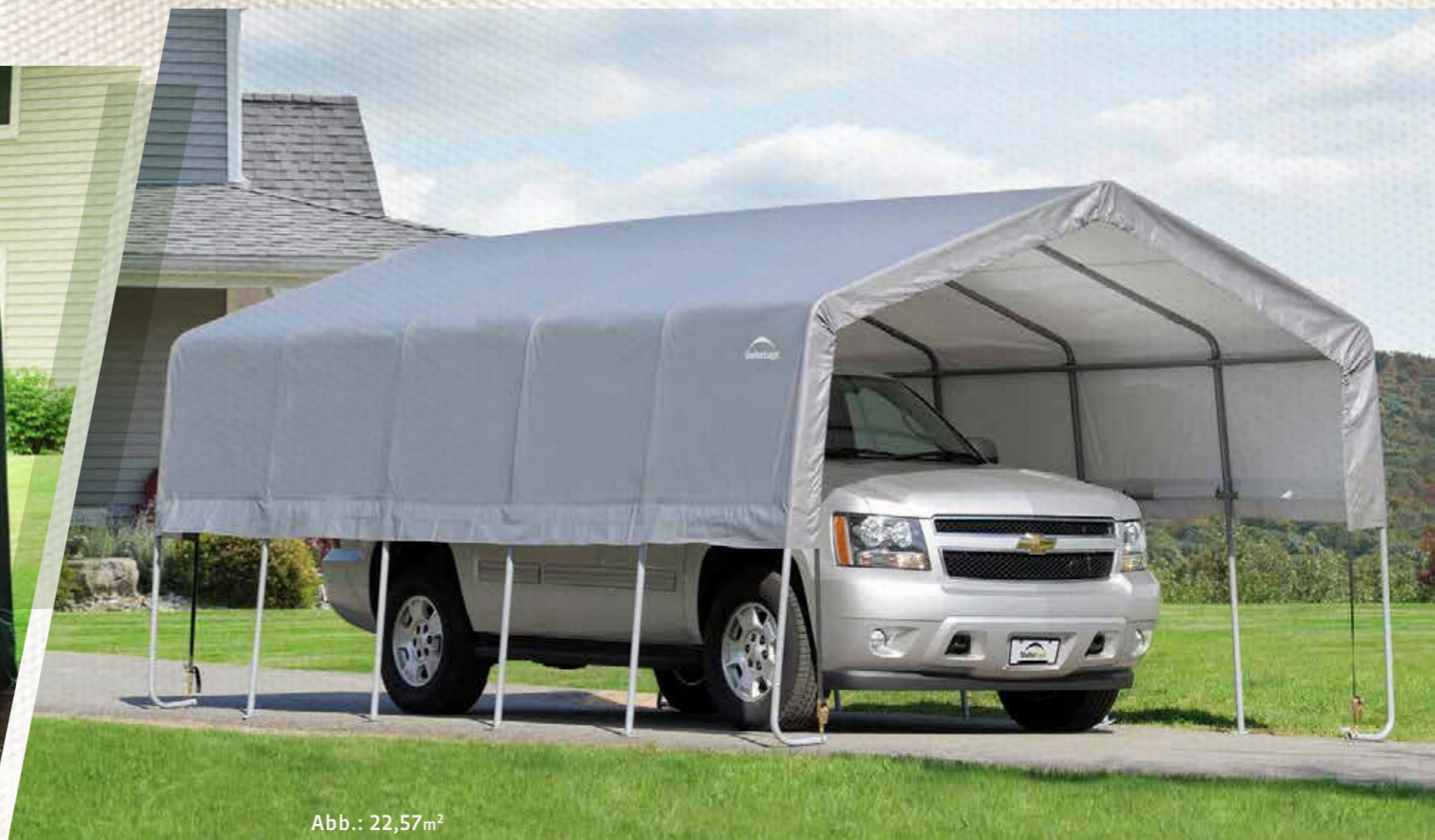
Abb.: 22,57m 2