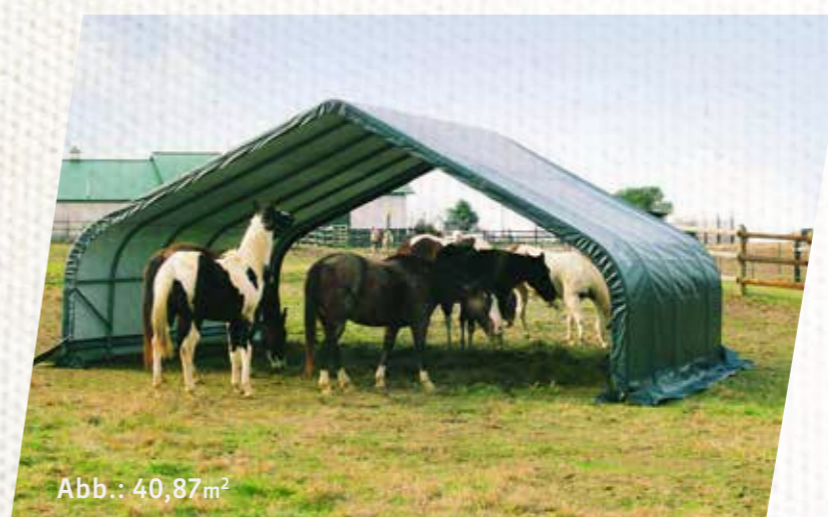
Abb.: 40,87m 2