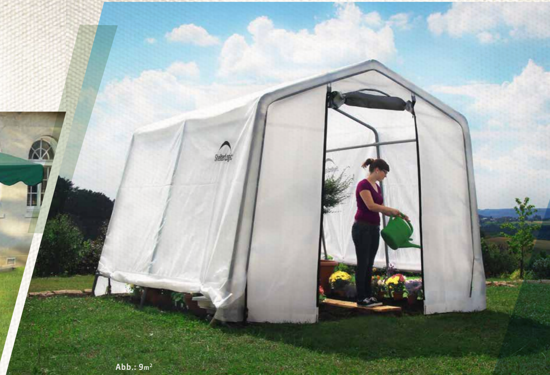
Abb.: 9m 2