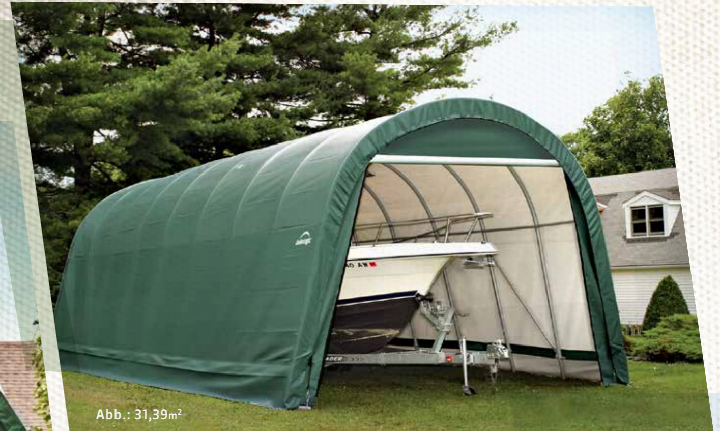
Abb.: 31,39m 2