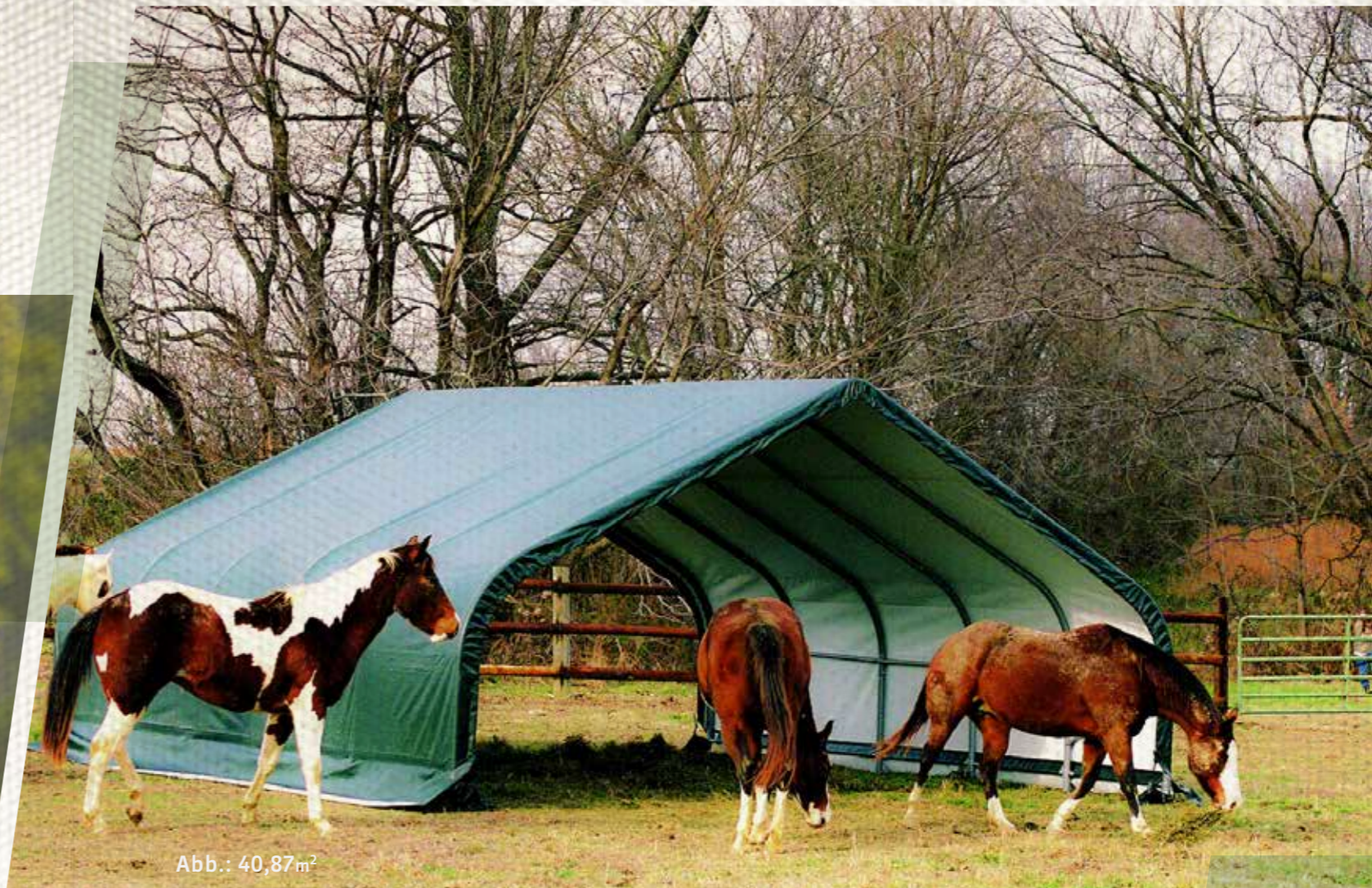
Abb.: 40,87m 2