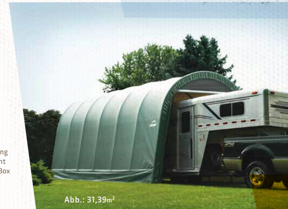
Abb.: 31,39m 2

Mitgelieferte Zurrgurte sichern die Festigkeit der Plane am Gestell bei Wind und Wetter. Inkl. Sturmmanker zur festen Fixierung im Boden enthalten. Ein Fundament ist nicht erforderlich. In nur einer Box verpackt.