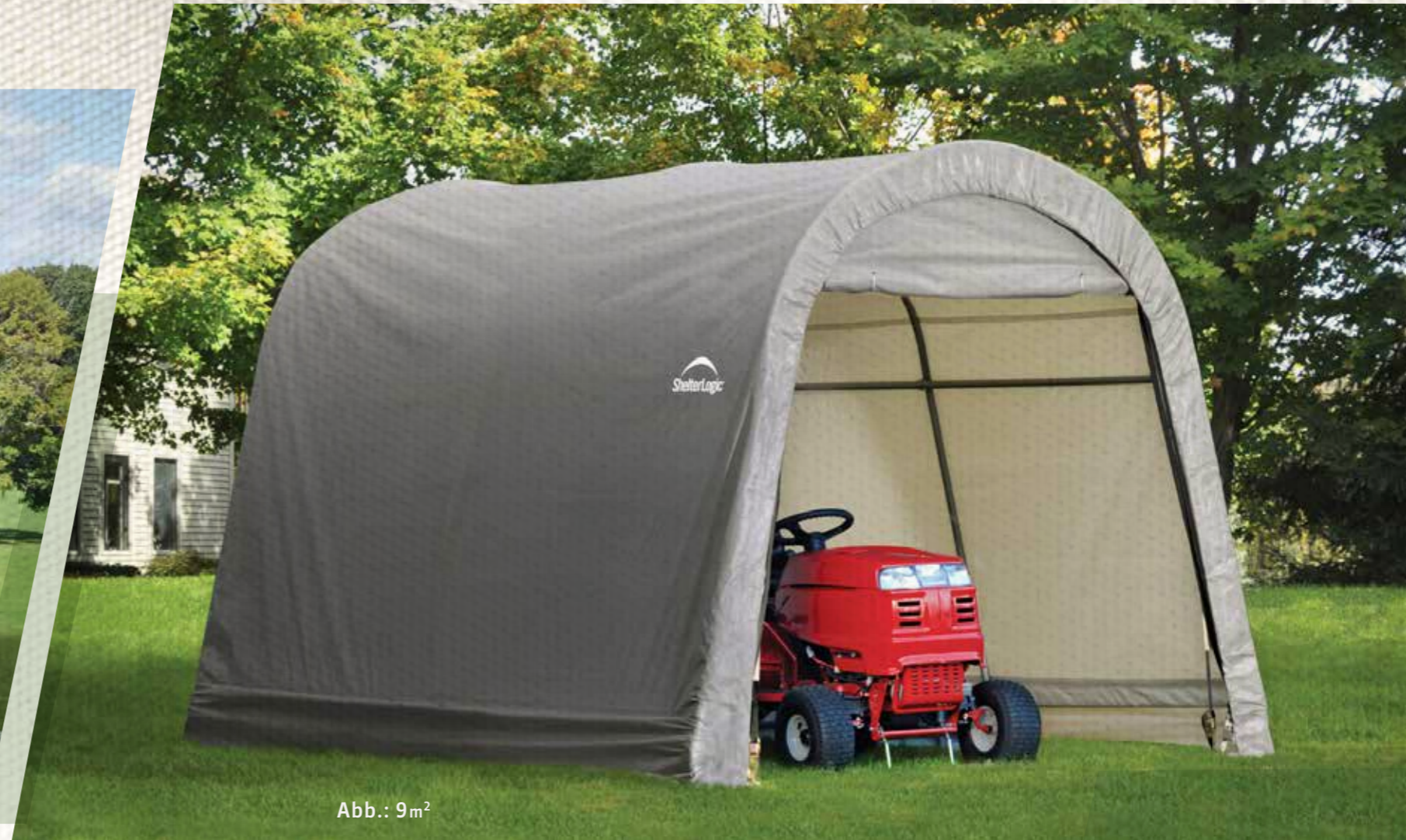
Abb.: 9m 2