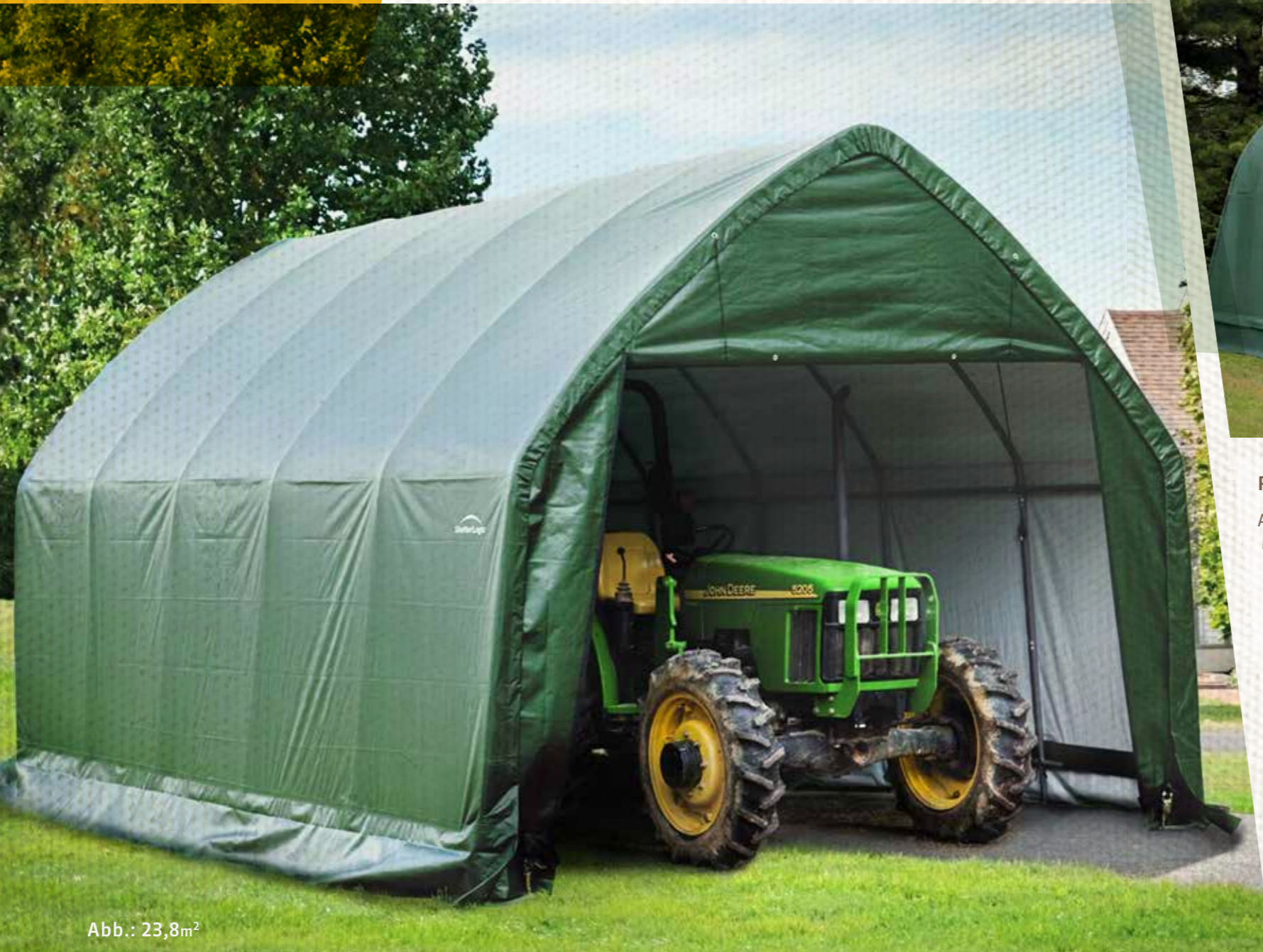
Abb.: 23,8m 2