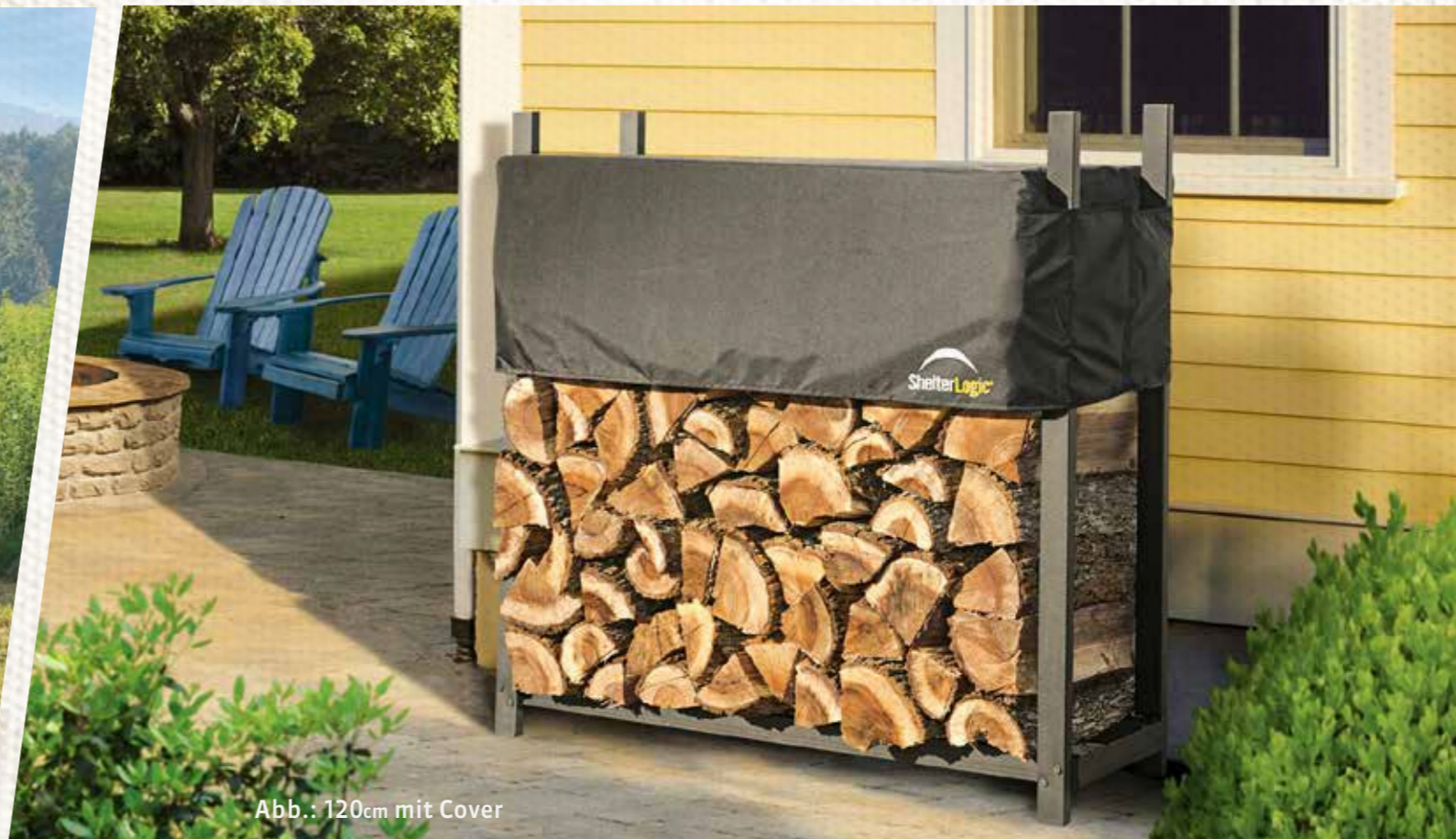
Abb.: 120cm mit Cover