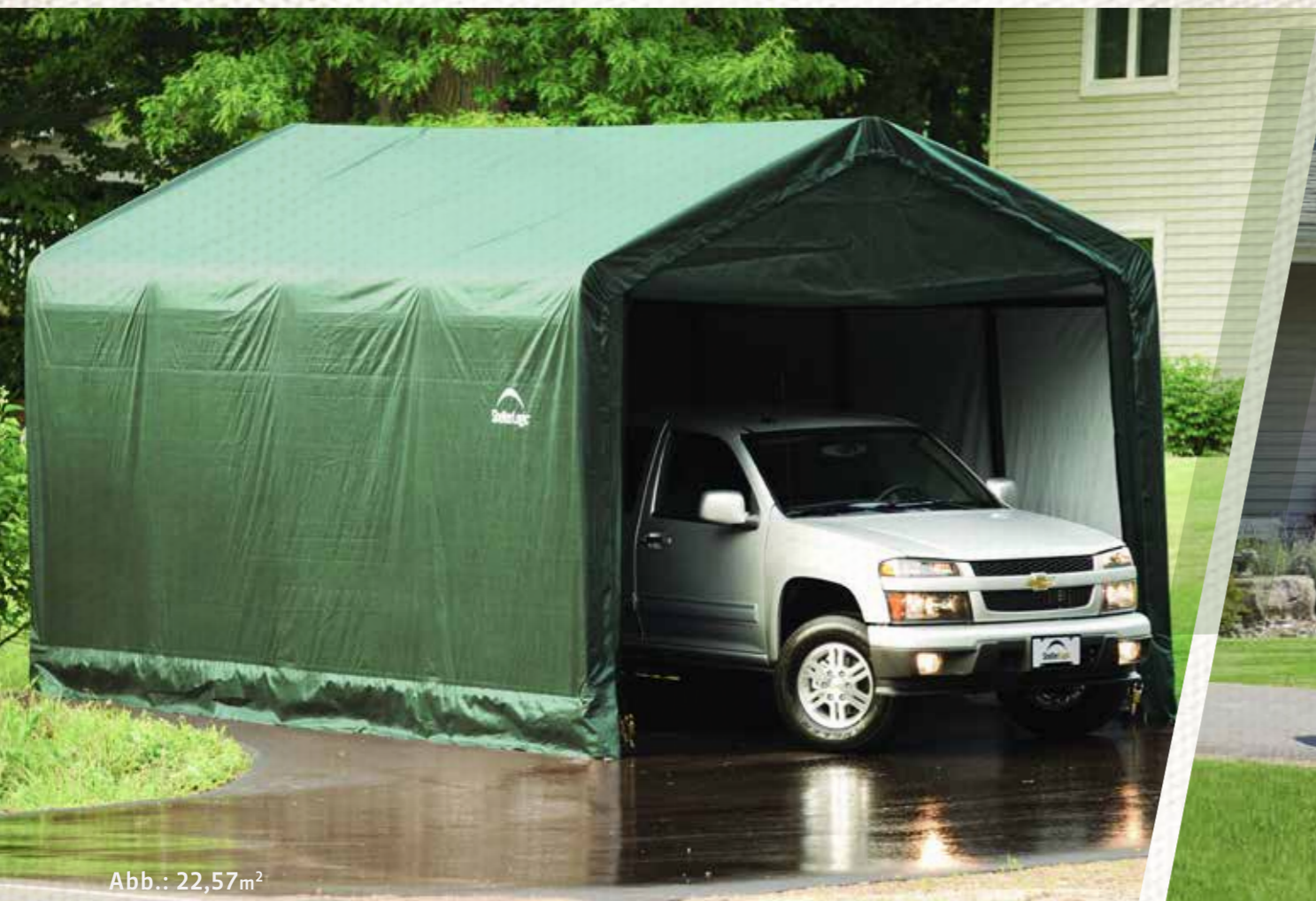
Abb.: 22,57m 2